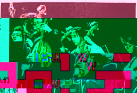
图 8-1-3 中国民乐演奏

不同的调式结构,代表着不同时代背景下人们的审美感受和审美认知。因而,要辩证地理解才能切合客观实际,从而更好地把握音乐的性格。